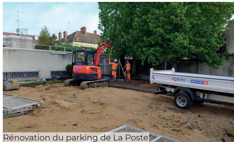
Rénovation du parking de La Poste

le parking de la Sablière qui se trouve à moins de 5 minutes du Centre-Ville et qui est sous vidéosurveillance pour assurer la sécurité des véhicules, sera également accessible.