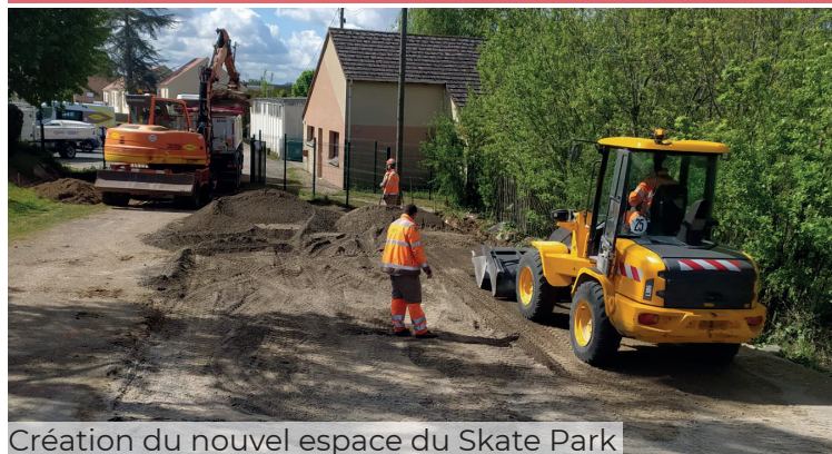
Création du nouvel espace du Skate Park

Pour installer la base vie du chantier à la Sablière, une partie des modules du Skate Park a déménagé provisoirement au Parc René Léger. L'occasion de rénover certains des modules et de repenser, demain, avec les pratiquants, la configuration d'ensemble.